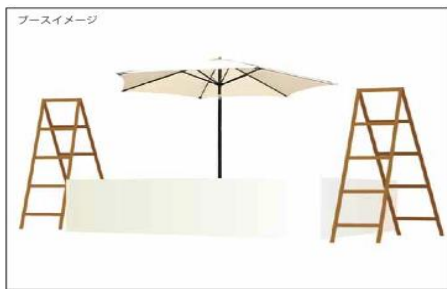
ブース詳細 (基本2店舗一組)